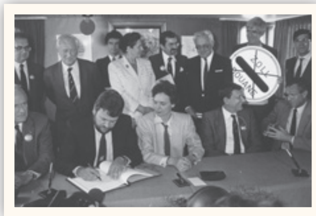
Jean Weirich, Archives Luxemburger Wort

Καταργήθηκαν οι έλεγχοι στα σύνορα με την Ιταλία (η συμφωνία υπεγράφη τον Νοέμβριο του 1990)