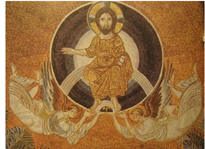
Η Ανάληψη του Χριστού Λεπτομέρεια του ψηφιδωτού του τρούλου της Αγίας Σοφίας Θεσσαλονίκης

Η ανάληψη του Χριστού σηματοδοτεί το τέλος της επίγειας δράσης του, όχι όμως και της παρουσίας του στον κόσμο. Το σωτηριώδες έργο του αναλαμβάνει να συνεχίσει τώρα η Εκκλησία με την καθοδήγηση του Αγίου Πνεύματος, το οποίο ο ίδιος ο Χριστός είχε υποσχεθεί να στείλει στους μαθητές του, σύμφωνα με το αποστολικό ανάγνωσμα 1 της ημέρας και το απολυτίκιο της γιορτής 2 , και γι' αυτόν τον λόγο ως τον δ' μ.Χ. αιώνα τα δύο γεγονότα, Ανάληψη και Πεντηκοστή, συνεορτάζονταν σε μία γιορτή.