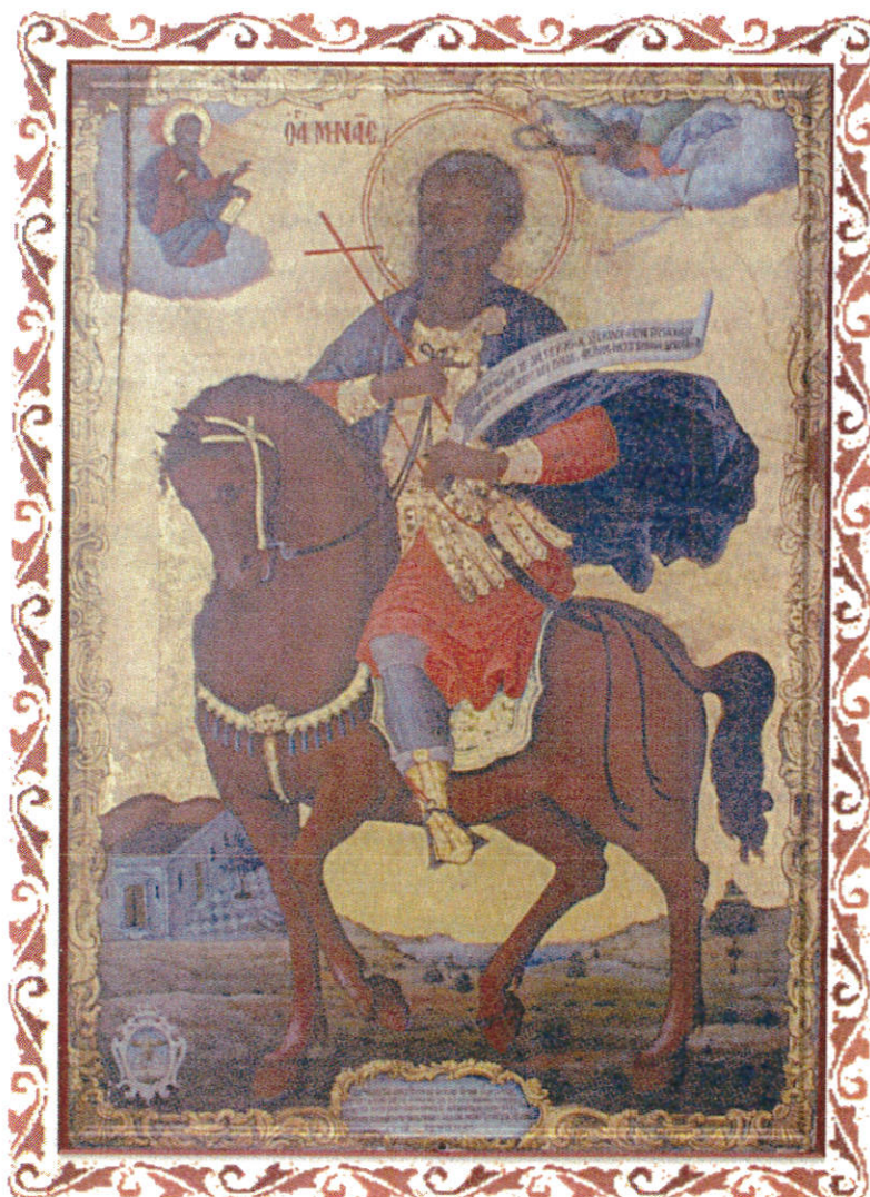
Η Θαυματουργή Εικόνα του Αγίου Μηνά, πιθανόν έργο του Γεωργίου Καστροφύλακα, 18 ος αϊ. (φυλάσσεται στο μικρό Ιερό Ναό του Ηρακλείου)