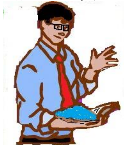
Σχήμα 2: Ο «Καθηγητής»

Η πορεία της παρουσίασης θα είναι η εξής: